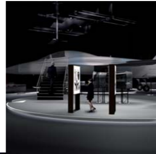
1996 Proyecto de mobiliario expositivo para MTC Las Palmas Ingenieria cultural, S.A.