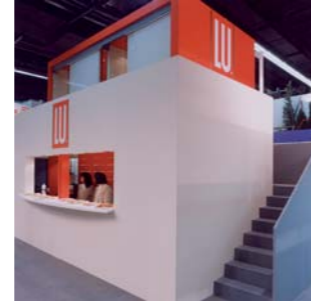
1992 STAND LU