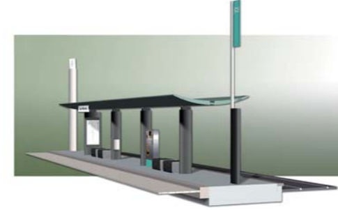
2000 Proyecto de concurso para el diseño de la MARQUESINA DEL "TRANVÍA DE BILBAO" CIAC Internacional, S.A.