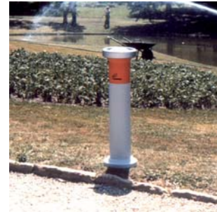
1982 CENICERO URBANO Con B.M.P. Asociados