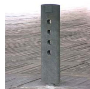
2007 PAL. Ecoaparcamiento para bicicletas Programa Català d'Ecodisseny ICTA, CEMA, ADI