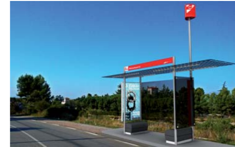
2008 TRANSBORD Concurso. Diseño y definición de los equipamientos identificadores de parada del transporte. Direcció General de Transports