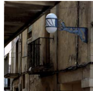
1984 FANAL BLAUHAUS TÀRREGA Desarrollo del diseño original de Guillermo Tejada Tex