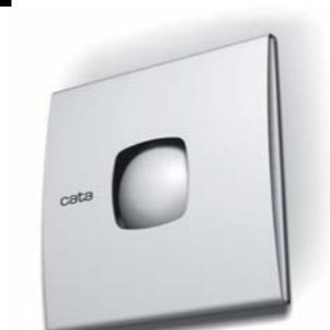
2002 SILENTIS CATA. Electrodomésticos S.L.