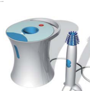
2004 KITCHEN CLEANER MITCO