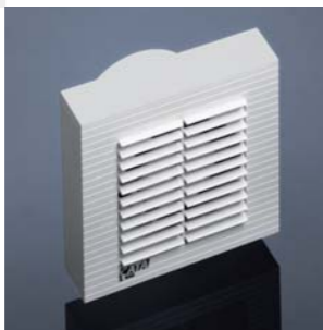
1990 B-10 CATA. Electrodomésticos S.L.