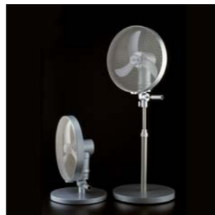
2001 CROM CATA. Electrodomésticos S.L.