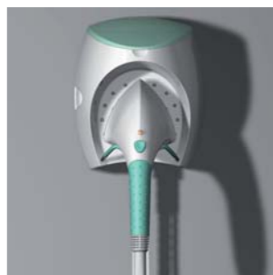
2004 SF-430 MITCO