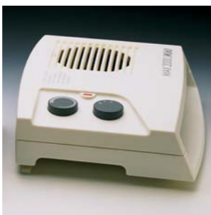
1995 MAX 2000 CATA. Electrodomésticos S.L.