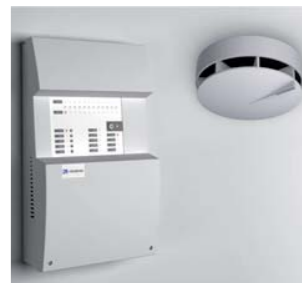
2010 CIRFIRE CIRCONTROL