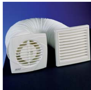
1997 B-10 PLUS CATA. Electrodomésticos S.L.