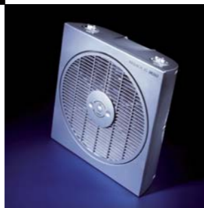
2001 WINDBOX 30 CATA. Electrodomésticos S.L.