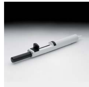
1988 JBC DU-1191 Industrias JBC, S.A.