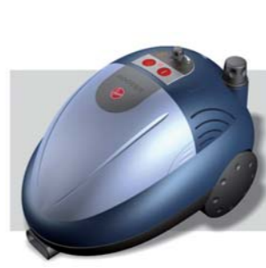
2004 CANDY MITCO