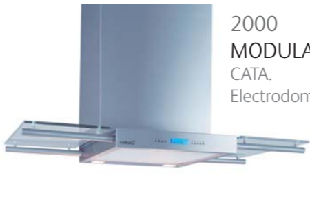
2000 MODULA CATA. Electrodomésticos S.L.