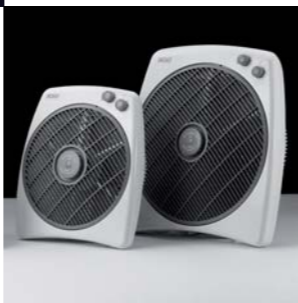
1999 TURBO 30/40 CATA. Electrodomésticos S.L.