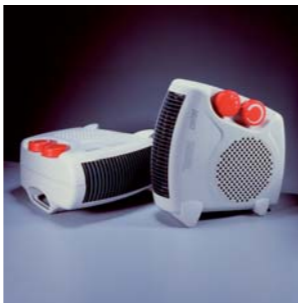
2000 TH3000 CATA. Electrodomésticos S.L.