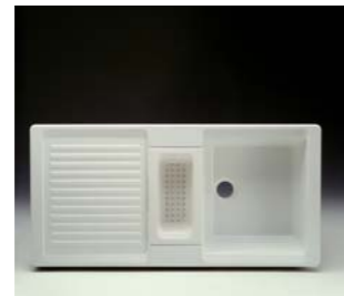
1990 CHEF I ROCA