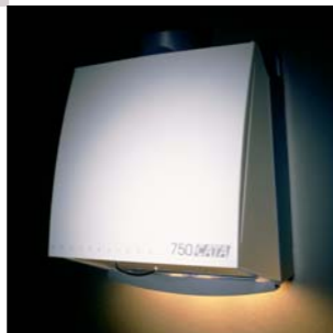
1995 PROFESSIONAL 750 CATA. Electrodomésticos S.L.