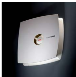
2002 X-MART CATA. Electrodomésticos S.L.