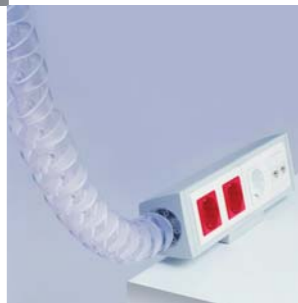
2006 GUÍA ARTICULADA S-51 UNEX Aparellaje eléctrico, S.L.